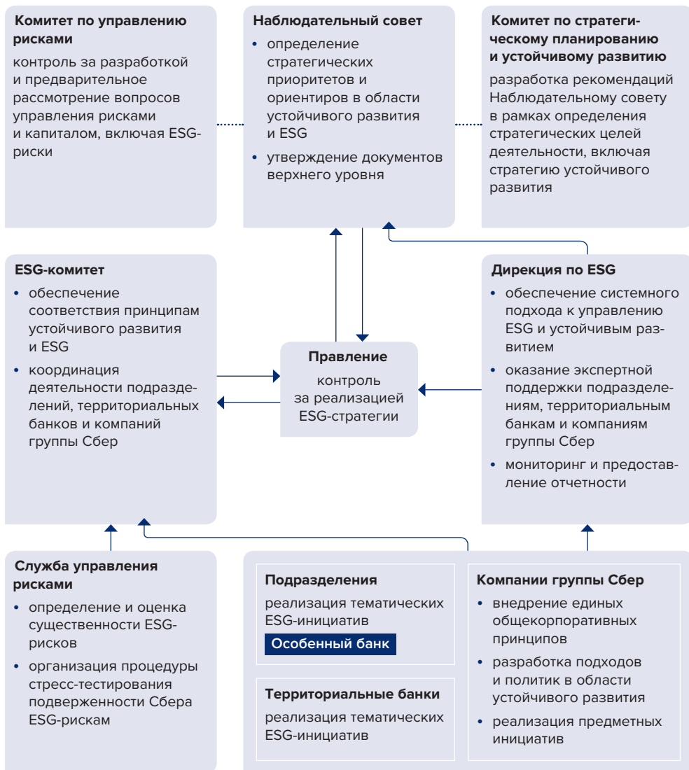
Рисунок. Место проекта «Особенный банк» в организационной структуре управления в области ESG и устойчивого развития СберБанка