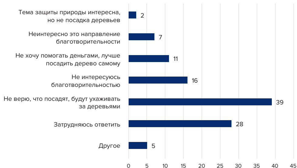
Рисунок 2. Барьеры вовлечения в проект (процент респондентов, давших соответствующий ответ на вопрос «Уточните, почему нет (не оплачивали бы посадку деревьев в рамках проекта “Подари лес другу”?»); можно было выбрать несколько вариантов ответа)