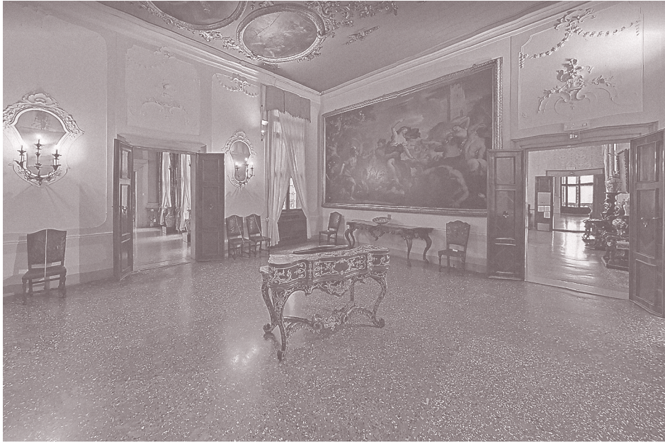
1. Пьетро Пицфетти. Письменный стол. 1741 год. Венеция. Зал Ладзарини дворца Ка-Реццонико

только ее. Зато, обладая этой функцией, вещь выходит за предписанные ей бытом границы и способна преобразовать пространство вокруг себя (илл. 1).