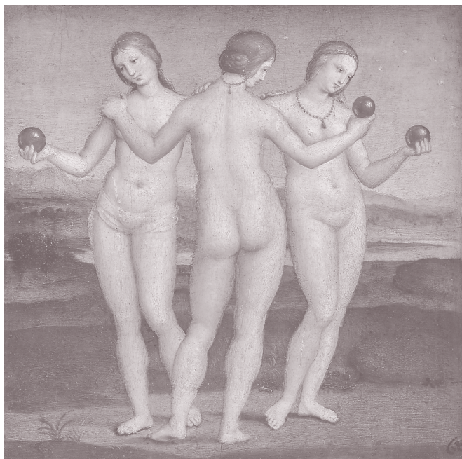
3. Рафаэль Санти. Три грации. 1503–1505 годы. Замок- усадьба Шантийи. Музей Конде

все же остается непоколебимой» 38 . Это, при всем уважении к замечательному мыслителю, — образец анахронистического, волюнтаристского анализа, неприемлемого ни в эстетике, ни в искусствознании.