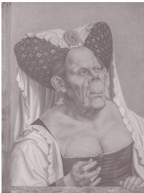
4. Квентин Массейс. Уродливая герцогиня. Около 1513 года. Лондон. Национальная галерея

мы «читаем» картину, она, словно в ответ, «высказывается», скульптура и архитектура «говорят», а если «молчат», то за этой оценкой историка искусства может стоять тот простой факт, что памятник ему непонятен или безразличен. Историк архитектуры может назвать постройку, например, «поэтической» или «прозаической». Он вкладывает в такие ко многому обязывающие характеристики смысл, который неспециалист понимает инстинктивно, но ведь формально архитектура не может быть ни поэзией, ни прозой.