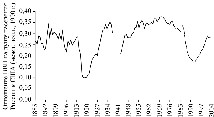
Рис. 1.2. Отношение ВВП на душу населения в России к аналогичному показателю в США, международные долл. США 1990 г.

Рассмотрим соотношение уровней доходов на душу населения между Россией и США в разных исторических периодах.