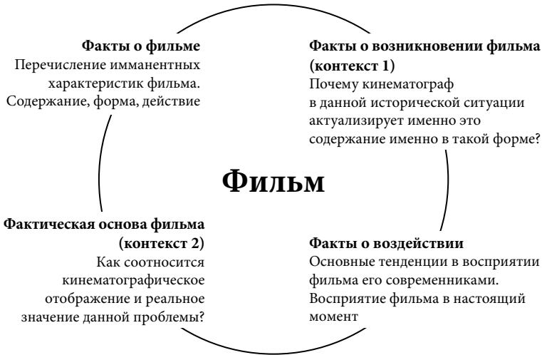
ИЛЛ. 1. Измерения анализа фильма

Фактическая основа фильма (контекст 2) — исследование фактологической исторической проблематики, отображенной в фильме: каково соотношение кинематографического отображения и реального значения данной проблемы либо исторических событий, лежащих в основе фильма?