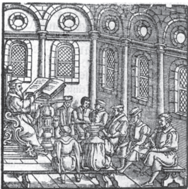
Рис. 1.1. Университетская лекция, из: Sebastian Münster, Cosmographie; das ist/ Beschreibung Aller Länder... , Basel, 1598 [1592]

университетам. Изображаемая сцена, стало быть, предлагает некое обобщение, а не моментальный снимок какой-то особенной лекции. Характер окон и стен подсказывают, что лекция проходит в замке или церкви, тогда как у европейского научного сообщества могла быть, метафорически, лишь одна башня — из слоновой кости. В сущности, университетская архитектура изначально была церковной — и остается таковой для университетов с ностальгией и надлежащим для ее поддержания притоком средств. Напрашивается вывод: академическому пространству присущи скорее духовные коннотации, нежели светские. И, пусть и относительно небольшое, пространство это не сулит особенной теплоты.