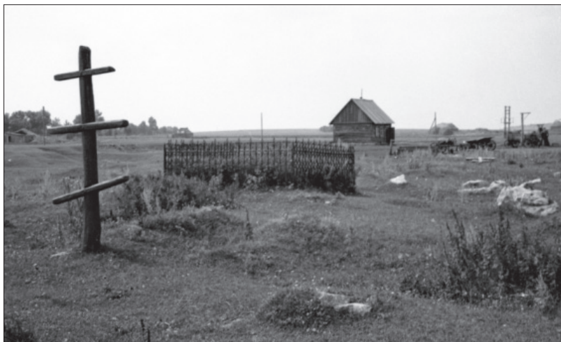
Старое кладбище в Журавинке, 1954 г.